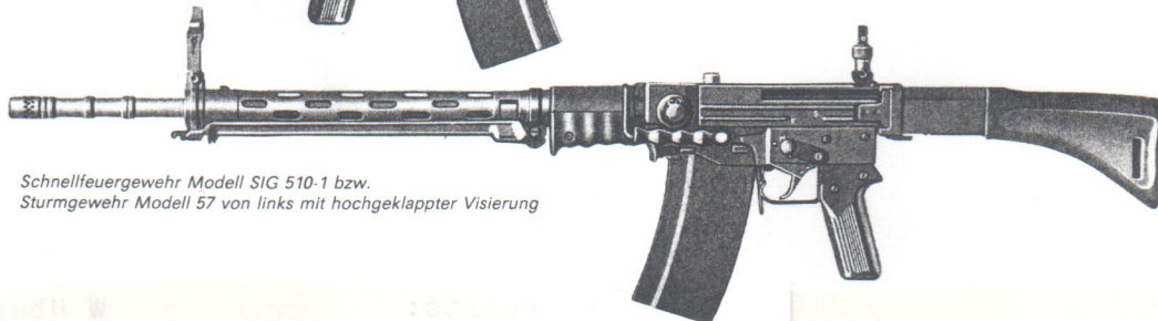
Schnellfeuergewehr Modell SIG 510-1 bzw. Sturmgewehr Modell 57 von links mit hochgeklappter Visierung