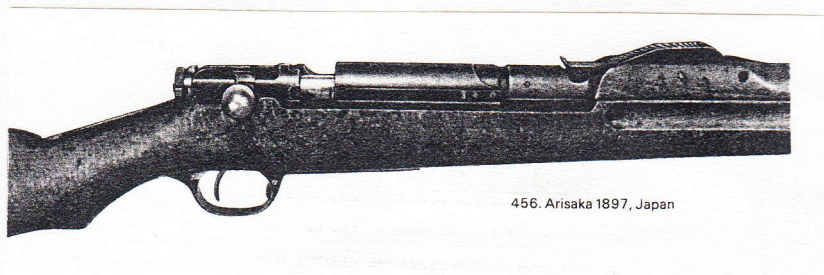
456. Arisaka 1897, Japan

Literatur: 2 / 9 / 12 / 27 / 29 / 30 / 42 / 52 / 53 / 59 / 70 / 102 /